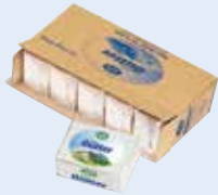
Teebutter Alpi Teebutter aus Sauerrahm 1128 - 5x1kg 1129 - 5kg Block