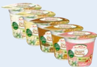
Rottaler Dessert Pudding 125g Becher 8743 - Panna Cotta 8744 - Vanille 8745 - Schoko 8746 - Caramel 8757 - Erdbeer