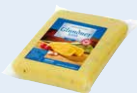
Glundner mager 19037 - 1kg Packung