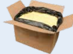
Butterblock Alpi Teebutter aus Süßrahm 1104 - 25kg Block