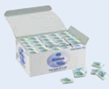
Teebutter Alpi Teebutter aus Sauerrahm 1127 - 200x10g