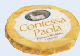
Contessa Paola 65% 19020 - ca. 1,3kg Torte