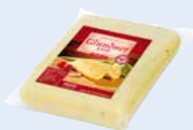
Glundner 25% 19039 - 1kg Packung