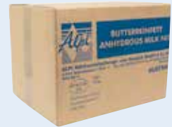
Butterreinfett Alpi 8248 - 25kg Block