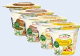
Rottaler Pudding zuckerreduziert 125g Becher 8740 - Schoko 8742 - Cappuccino 8755 - Vanille 8760 - Banane